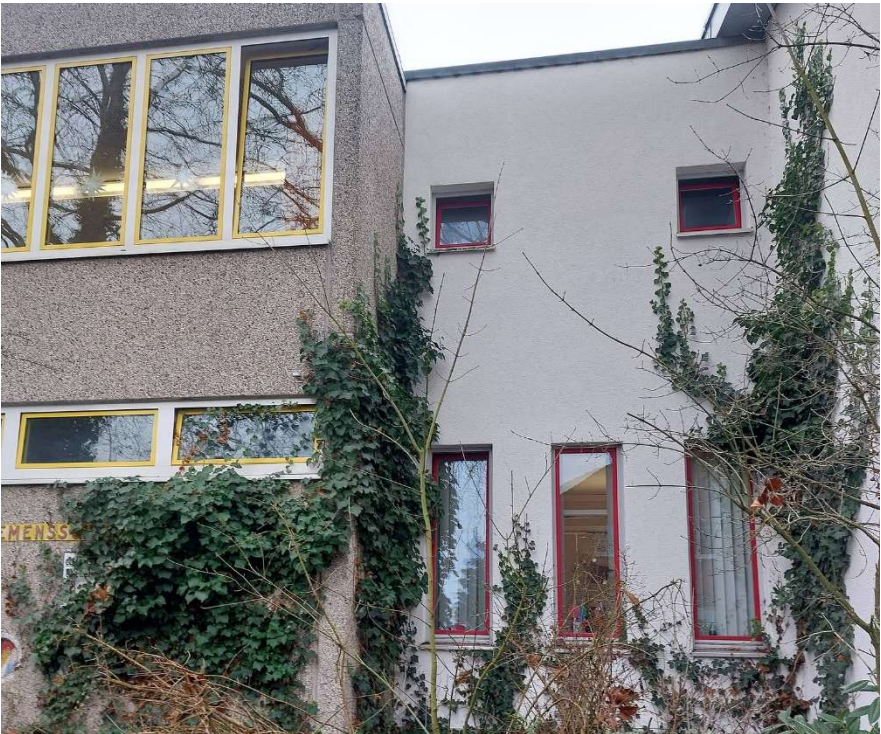
5. Übergang zum Verbindungsgebäude - Straßenseite