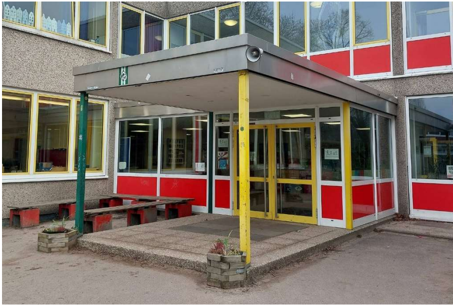
3. Eingang Vordach