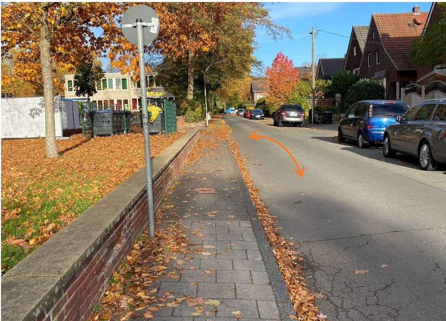
1 Zugang Unckelstraße