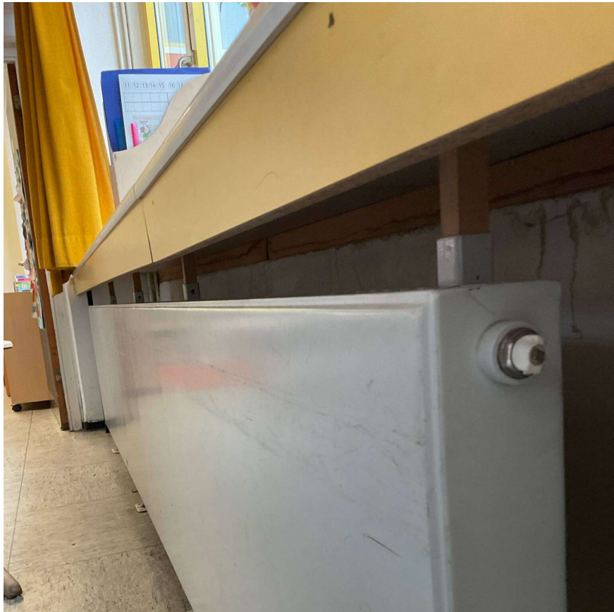
9. Rückbau der Fensterbänke - Detail