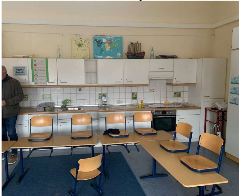
21. Küche im Raum 116.2.1.007/008