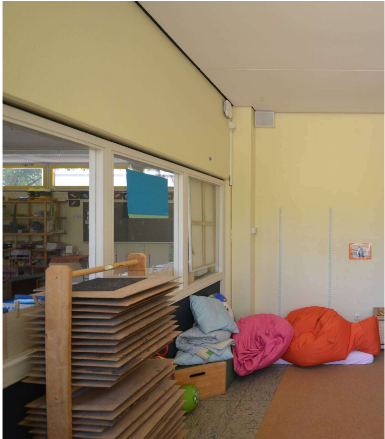
19. Installationsschacht für Fallrohre Entwässerungsrohre