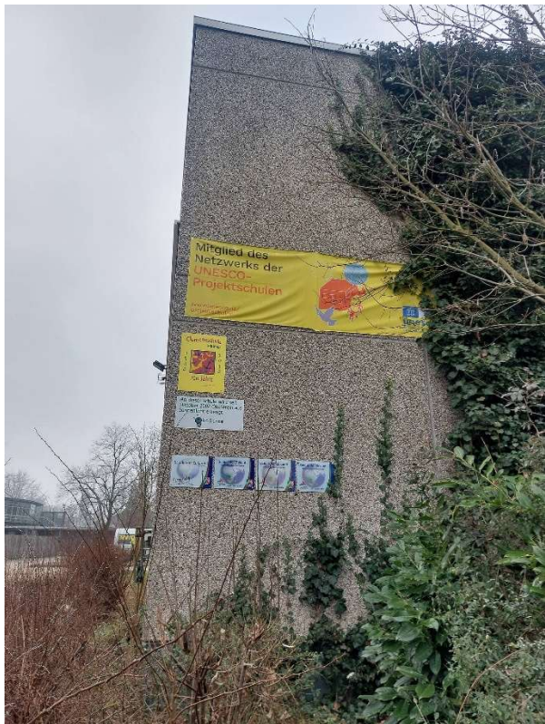
15. Anbauten an der Fassade