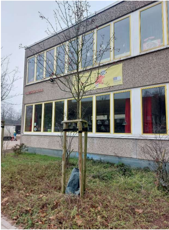
14. Anbauten an der Fassade