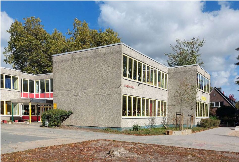
2. Fassade Waschbetonplatten (inkl. Anbauten und Strahler)