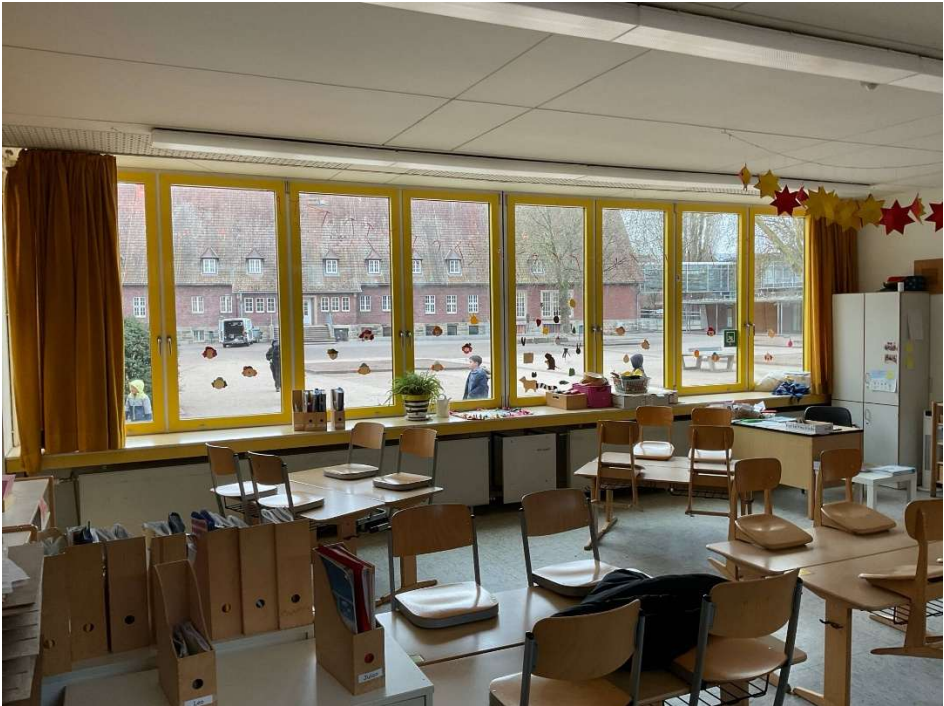
8. Rückbau der Fensterbänke / Abhangdecken