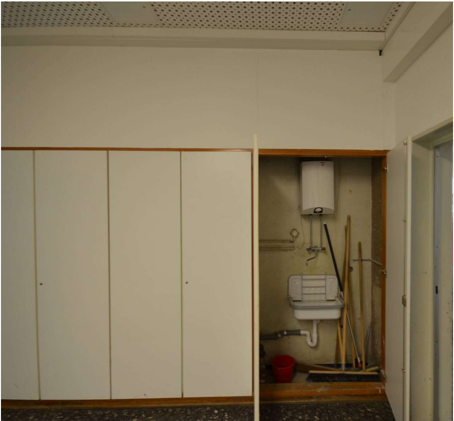
10. Rückbau Schrankwand im Flur