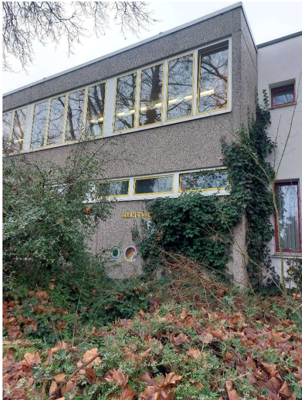
17. Anbauten an der Fassade