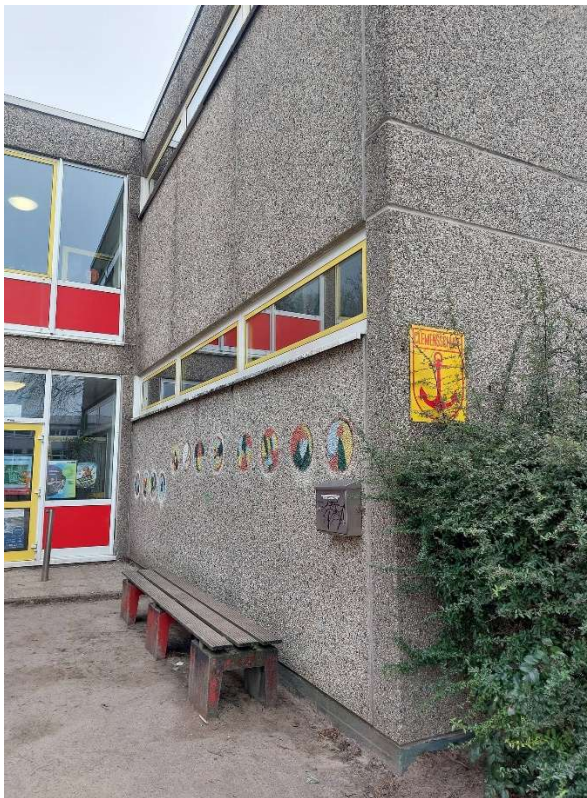
16. Anbauten an der Fassade