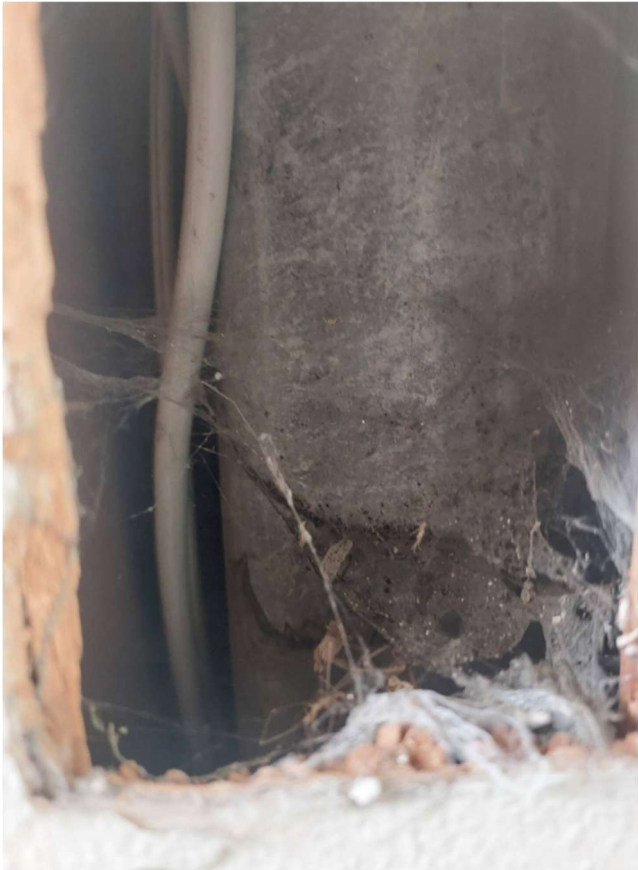
20. Fallrohr asbesthaltig Entwässerungsrohr