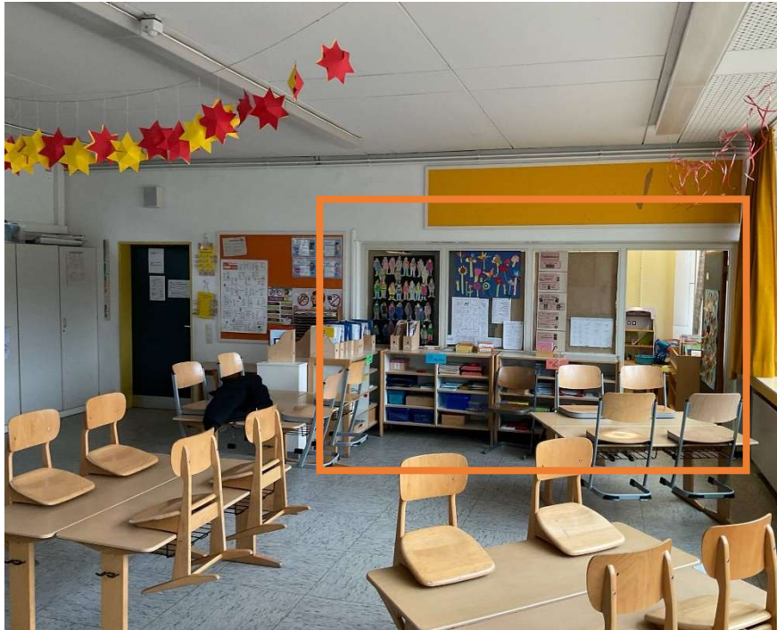
7. Rückbau einer Trennwand