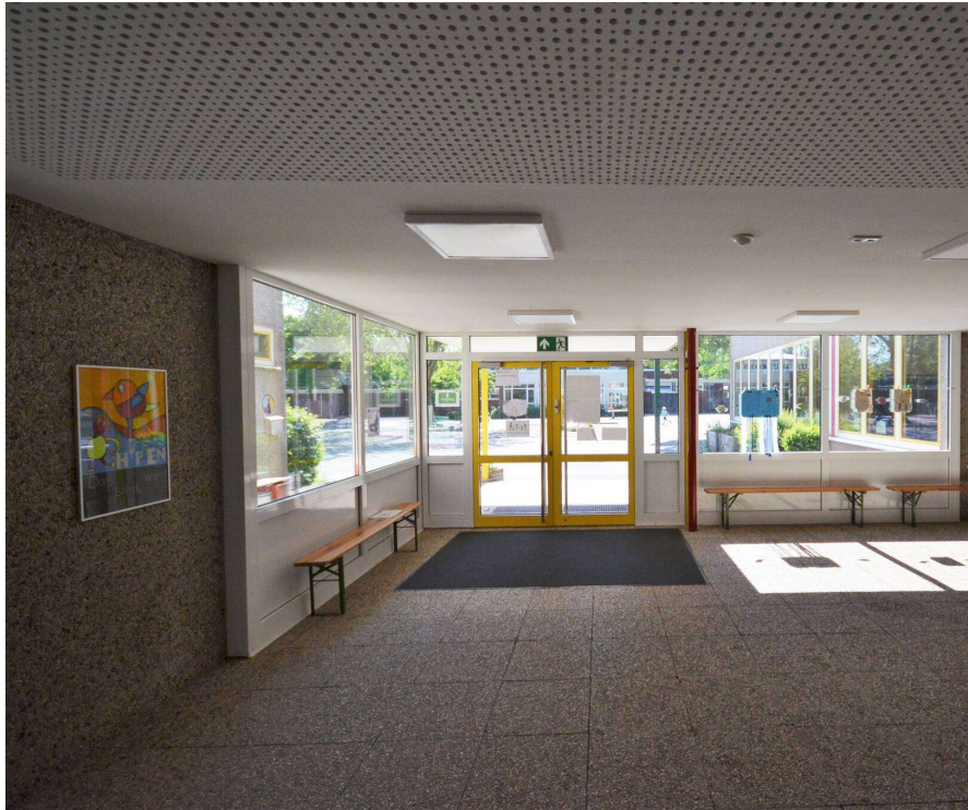
13. Eingangshalle mit Waschbetonboden etc.