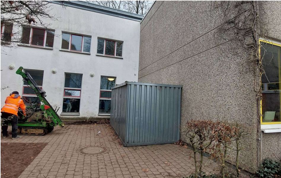
4. Übergang zum Verbindungsgebäude + Container