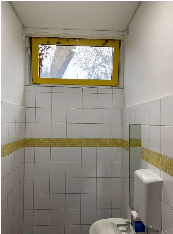
18. Rückbau der Fensterbank aus Fliesenbealg