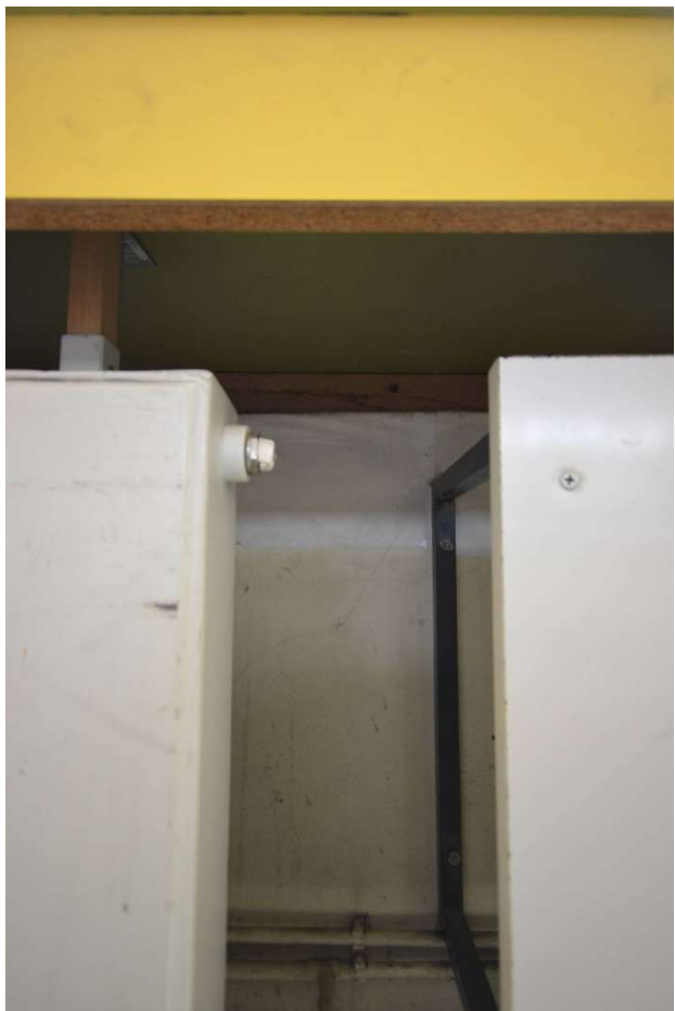
11. Elmenete zum Schließen der Fensterbanknische zwischen den Heizkörpern